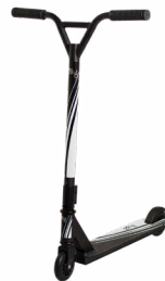
Wave White BNFK013-WWH EAN: 5404016424983