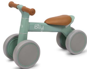
Green - Gray BLBK000004-GR EAN: 5404016487285