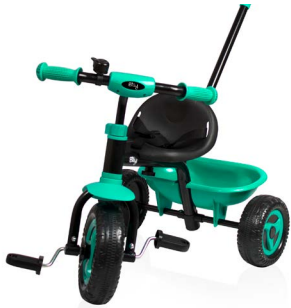
Black Blue BLFK012-BKBL EAN: 5404016403995