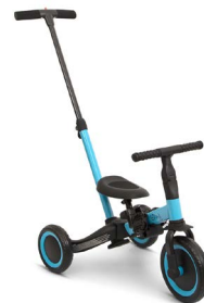
Blue BLBK000003-BL EAN: 5404016481146