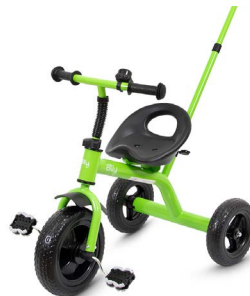
Lime BLBK000001-LM EAN: 5404016474865