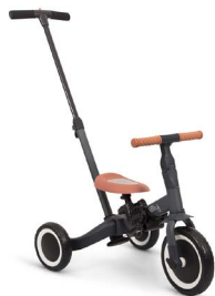
Grey BLBK000003-GY EAN: 5404016475046