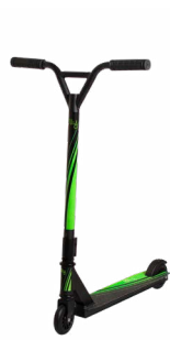
Wave Green BNFK013-WGR EAN: 5404016424990