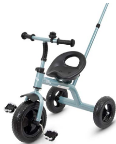
Blue/Gray BLBK000001-LBL EAN: 5404016474858