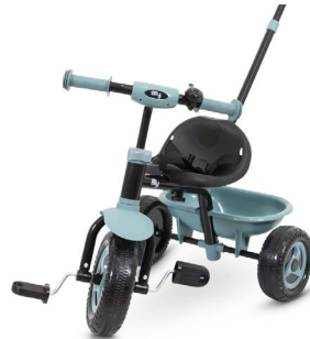
Blue/Gray BLFK012-LBL EAN: 5404016474827