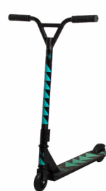
Blue Shark BNFK013-BLSHRK EAN: 5404016409119