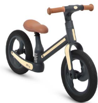
Gray BLBK000002-GY EAN: 5404016485342