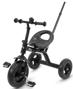
Black BLBK000001-BK EAN: 5404016474841