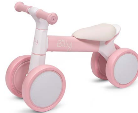
Pink - White BLBK000004-PK EAN: 5404016487292