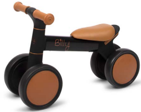
Black - Brown BLBK000004-BKBR EAN: 5404016487278