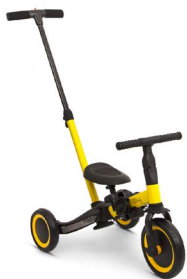
Yellow BLBK000003-YL EAN: 5404016481153