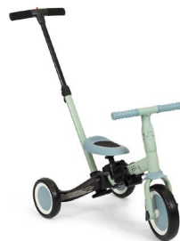
Blue - Green BLBK000003-MT EAN: 5404016485342