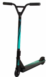
Wave Blue BNFK013-WBL EAN: 5404016409126