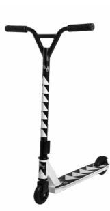
White Snow BNFK013-WHSN EAN: 5404016409140