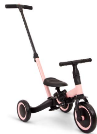
Pink BLBK000003-PK EAN: 5404016475053