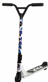
White Paint BNFK013-WHPNT EAN: 5404016409133