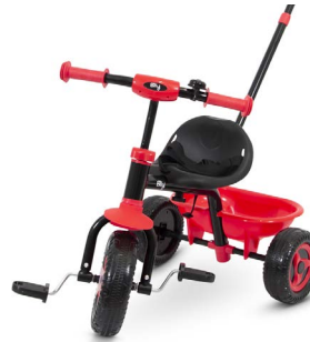
Pink/Red BLFK012-PK EAN: 5404016474834