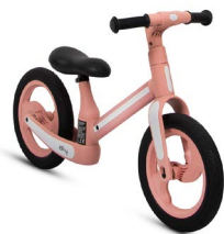
Pink BLBK000002-PK EAN: 5404016475039